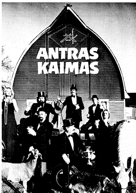
Antras kaimas 1980 m.